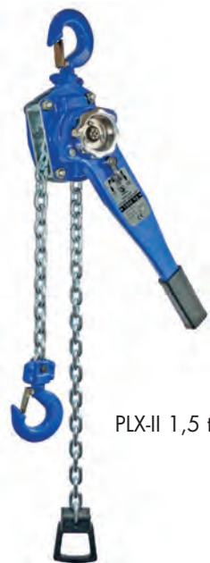
PLX-II 1,5 t