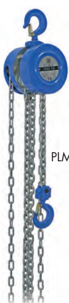
PLM-II 1 t