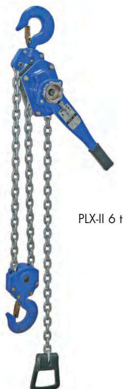
PLX-II 6 t