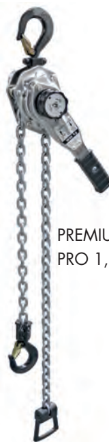
PREMIUM PRO 1,6 t