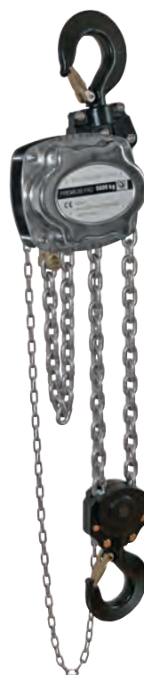
PREMIUM PRO 5 t