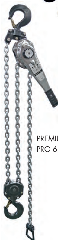
PREMIUM PRO 6,4 t